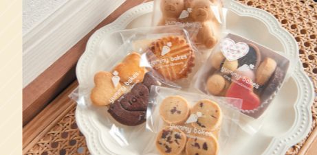
フロランタンもなか(2くま170円)など、焼き菓子各種 170円～