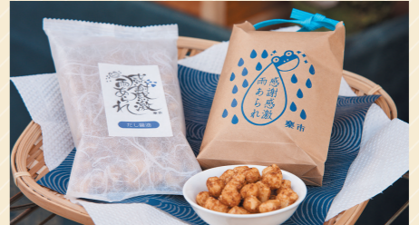
粋アラレだし醤油 438円(左・まかない袋 247円)