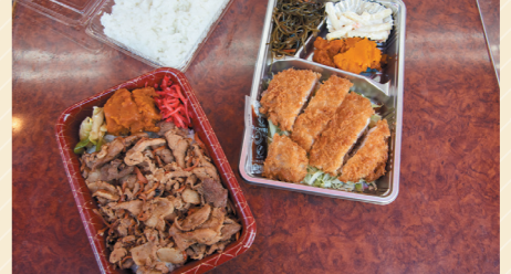
スタミナヤキニク丼 580円、トンカツ弁当 630円